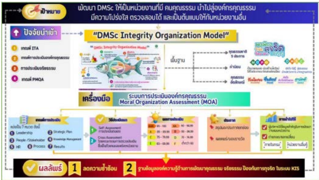
ภาพประกอบ : แนวทางการพัฒนาองค์กรคุณธรรมของกรมวิทยาศาสตร์การแพทย์