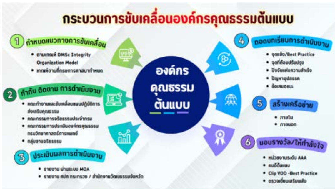
ภาพประกอบ กระบวนการขับเคลื่อนองค์กรคุณธรรมต้นแบบ กรมวิทยาศาสตร์การแพทย์