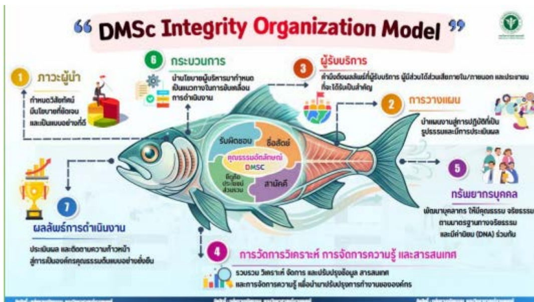
ภาพประกอบ : DMSc Integrity Organization Model กรมวิทยาศาสตร์การแพทย์

๓. การทำความดีสามารถทำคู่ขนาดไปกับงานประจำได้โดยไม่จำเป็นต้องไปทำเพิ่มเติม และให้มุ่งเน้นผลลัพธ์และคุณภาพจากการปฏิบัติมากกว่าจำนวนครั้งในการทำกิจกรรม