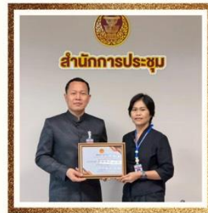
ด้านวินัยและด้านกตัญญู กลุ่มงานนิติ