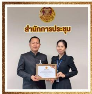
ด้านพอเพียง กลุ่มงานระเบียบวาระการประชุมวุฒิสภา