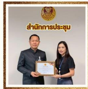
ด้านจิตอาสา กลุ่มงานบริหารทั่วไป