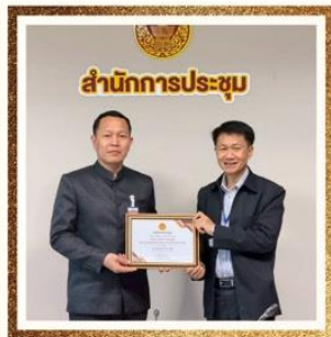
ด้านสุจริต กลุ่มงานพระราชบัญญัติ