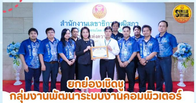
ยกย่องเชิดชู กลุ่มงานพัฒนาระบบงานคอมพิวเตอร์

เหตุผลที่กลุ่มงานพัฒนาระบบงานคอมพิวเตอร์เป็นกลุ่มงานที่มีผลงานด้านคุณธรรมและความโปร่งใส เนื่องจากเห็นว่ากลุ่มงานพัฒนาระบบงานคอมพิวเตอร์มีการปฏิบัติงานเป็นที่ประจักษ์ด้านจิตบริการ มีคุณธรรมและความโปร่งใส งานที่ติดต่อประสานงาน หรืองานด้านเอกสารมีข้อผิดพลาดหรือบกพร่องน้อยที่สุด รวมถึงเป็นกลุ่มงานที่มีระบบการจัดการงานที่ชัดเจนและเป็นระบบที่เอื้อต่อการปฏิบัติหน้าที่ของสำนักเทคโนโลยีสารสนเทศและการสื่อสารมากที่สุด