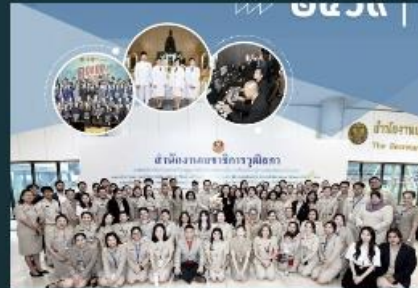
สำนักประชาสัมพันธ์ (สว.)ขอเผยแพร่คู่มือ การปฏิบัติงาน ของสำนักประชาสัมพันธ์