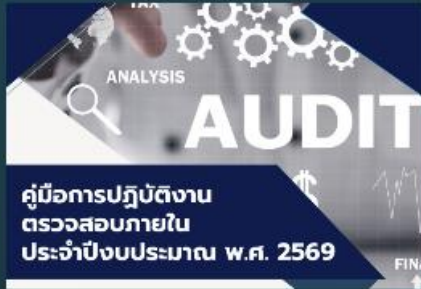
คู่มือการปฏิบัติงาน ตรวจสอบภายใน ประจำปีงบประมาณ พ.ศ. 2569