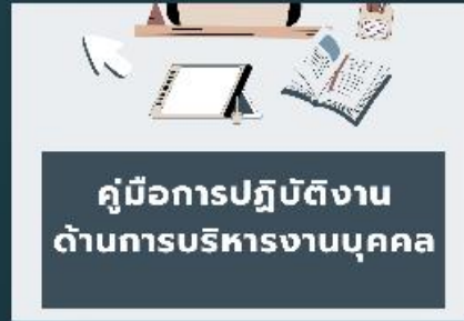
คู่มือการปฏิบัติงาน ด้านการบริหารงาน บุคคล ประจำปีงบประมาณ พ.ศ. 2569