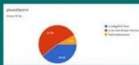
ผลการคัดเลือก ครั้งที่ 2