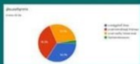
ผลการคัดเลือก ครั้งที่ 1