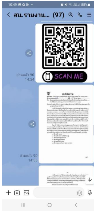
แบบฟอร์ม รายงานผลการดำเนินงานตามแผนบริหารความเสี่ยง