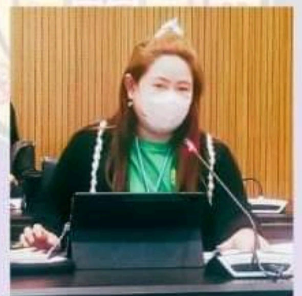
นำเสนอผลการประเมิน พฤติกรรมของบุคลากร สำนักวิชาการ

คณะทำงานขับเคลื่อนองค์กร STRONG จัดพอเพียงต้านทุจริต ส่งเสริม สนับสนุน คุณธรรม จริยธรรมและความโปร่งใส สำนักวิชาการ สำนักงานเลขานุการวุฒิสภา