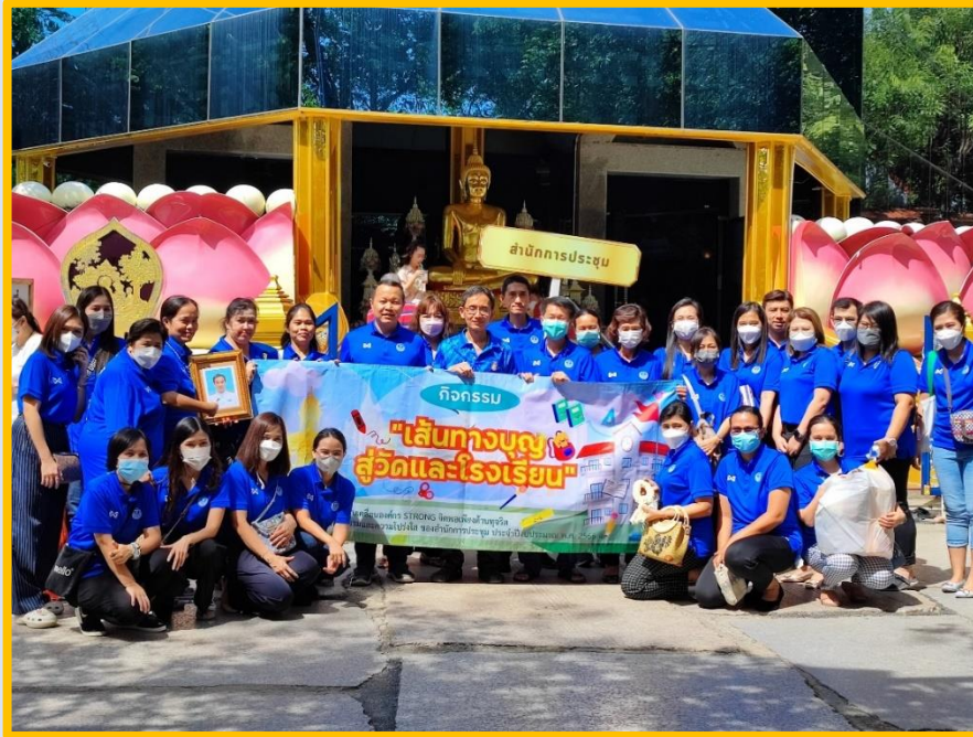
นำ "ข้าวเหนียวไก่ทอด" ไปร่วมทำโรงทานที่วัด