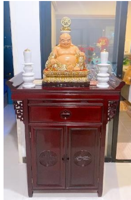
รูปโต๊ะพระที่บ้านพัก

จำนวน ๓๖๕ ครั้ง ทำเป็นประจำทุกวัน สถานที่ ที่บ้านพัก