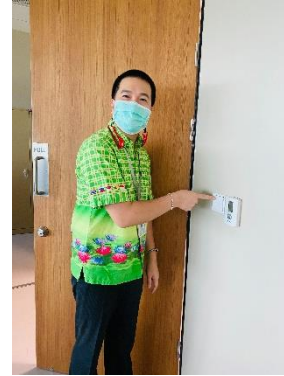
ตัวอย่างรูปการปล่อยปลา การคัดแยกขยะ และการปิดไฟเวลา ๑๒.๐๐ – ๑๓.๐๐ น.