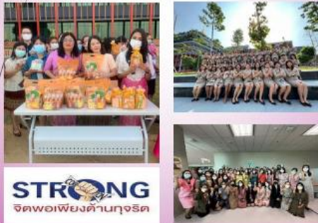
คณะทำงานขับเคลื่อนองค์กร STRONG จิตพอเพียงต้านทุจริต ส่งเสริมคุณธรรมและความโปร่งใส ของสำนักงานคสช.และงบประมาณ ประจำปีงบประมาณ พ.ศ. ๒๕๖๖

แผนส่งเสริม สนับสนุนการดำเนินการด้านคุณธรรม จริยธรรม ความโปร่งใส และการต่อต้านการทุจริต ของสำนักงานคสช.และงบประมาณ สำนักงานเลขาธิการวุฒิสภา ประจำปีงบประมาณ พ.ศ. ๒๕๖๖