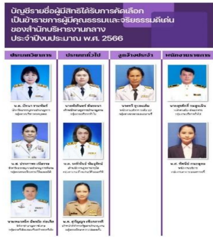
๑. ทาง line ของสำนักบริหารงานกลาง