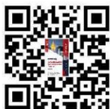
องค์ความรู้กระบวนการ สร้างองค์กรคุณธรรม