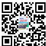
องค์ความรู้เฝ้าระวังการทุจริต