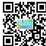
คลิปกระบวนการ สร้างองค์กรคุณธรรม