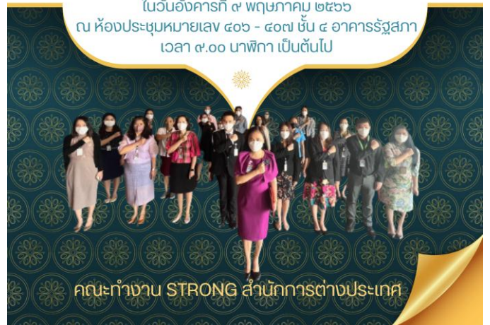
คณะทำงาน STRONG สำนักการต่างประเทศ

ในวันอังคารที่ ๙ พฤษภาคม ๒๕๖๖ ณ ห้องประชุมหมายเลข ๕๐๖ - ๕๐๗ ชั้น ๕ อาคารรัฐสภา เวลา ๙.๐๐ นาฬิกา เป็นต้นไป