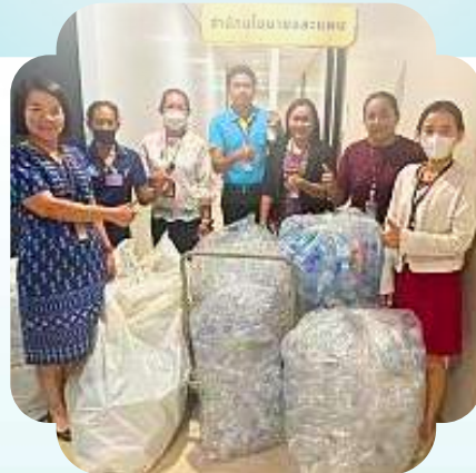
กิจกรรม “ขายขยะรีไซเคิล” นำเงินไปจัดซื้อ ของสำหรับทำกิจกรรมสาธารณะประโยชน์ ของสำนักนโยบายและแผน