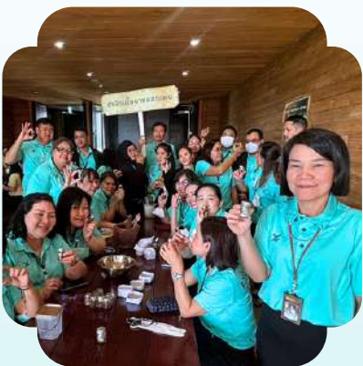
กิจกรรม “การทำยาดมสมุนไพรธรรมชาติ” ซึ่งเป็นภูมิปัญญาไทย ด้านเภสัชกรรมมาช้านาน