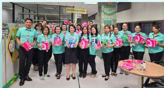
คณะทำงานขับเคลื่อนองค์กร STRONG จิตพอเพียงต้านทุจริตส่งเสริมคุณธรรม และความโปร่งใสของสำนักนโยบายและแผน ประจำปีงบประมาณ พ.ศ. ๒๕๖๗