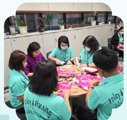
กิจกรรม “พับถุงใส่ยา” มอบให้ โรงพยาบาลเฉลิมพระเกียรติ จังหวัดบุรีรัมย์