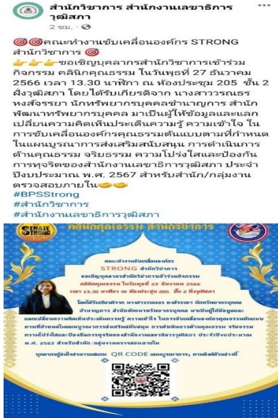
เฟซบุ๊ก ชมรม Strong จิตพอเพียง ด้านทุจริตข้าราชการ สว.