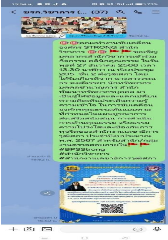
เฟซบุ๊กคุณธรรม ข้าราชการ สว.