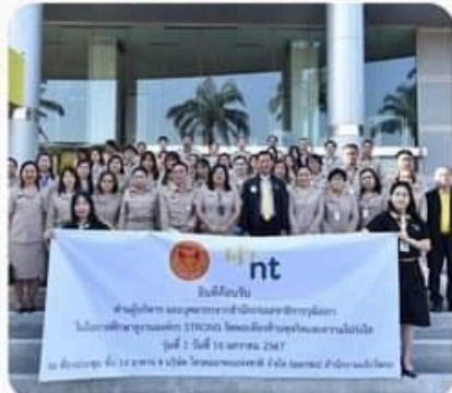
คณะทำงานขับเคลื่อนองค์กร STRONG จิตพอเพียงด้านทุจริต ส่งเสริมคุณธรรมและความโปร่งใสของสำนักการคลังและงบประมาณ ประจำปีงบประมาณ พ.ศ. ๒๕๖๗