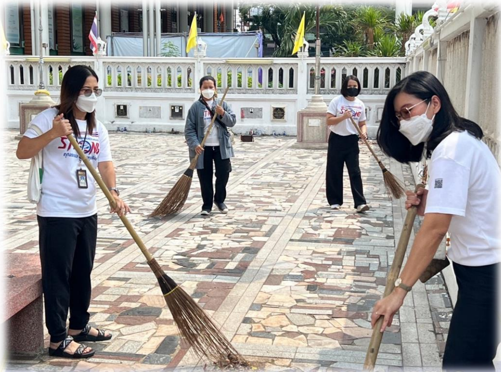
The Secretariat of the Senate