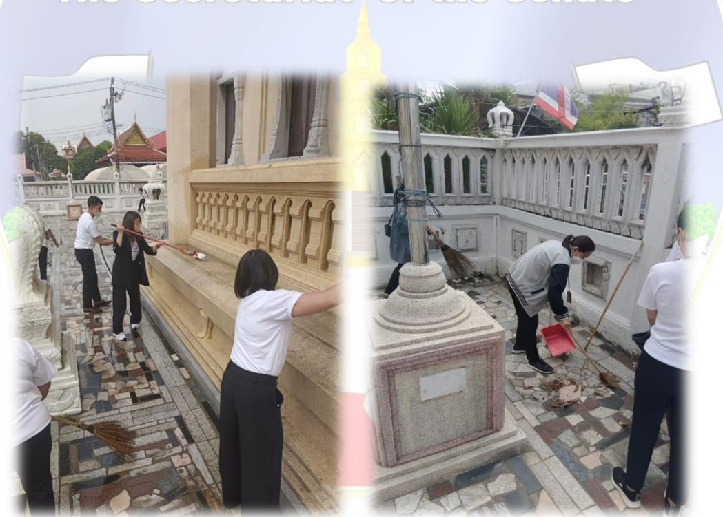
บุคลากรของสำนักกำกับและตรวจสอบได้ร่วมกันขัดฐานพระอุโบสถ