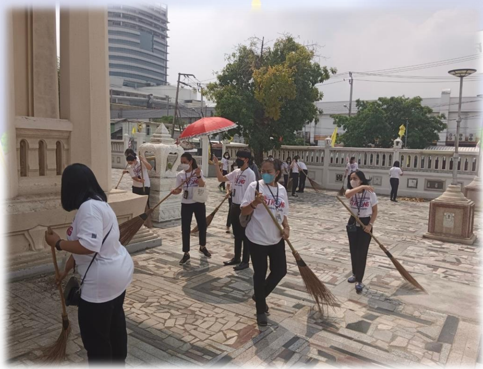
บุคลากรของสำนักกำกับและตรวจสอบได้ร่วมกันกวาดขยะ เศษใบไม้ บริเวณรอบพระอุโบสถ