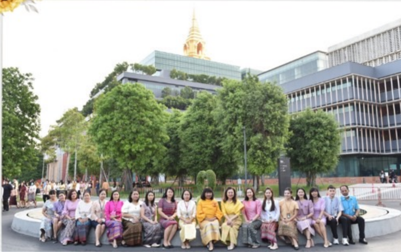
วันมาฆบูชา