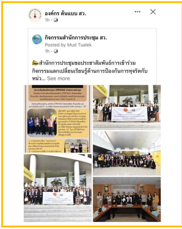
คณะทำงานขับเคลื่อนองค์กร STRONG จิตพอเพียงต้านทุจริต ส่งเสริมคุณธรรมและความโปร่งใส ของสำนักการประชุม