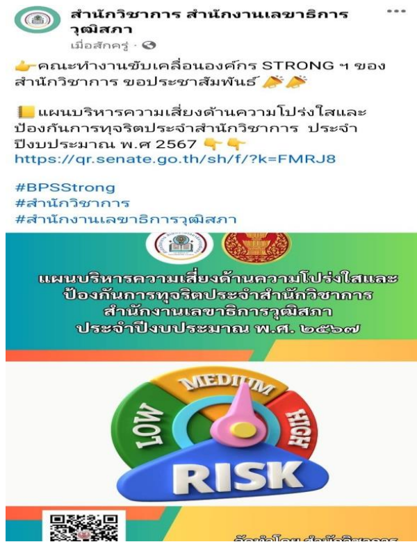
เฟซบุ๊ก ชมรม Strong จิตพอเพียง ต้านทุจริตข้าราชการ สว.