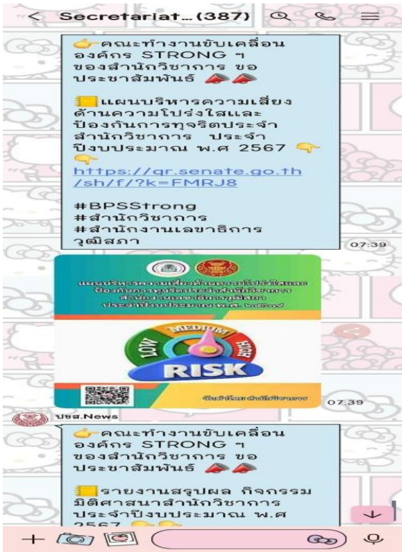
เฟซบุ๊กคุณธรรม ชำราชการ สว.