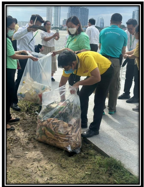
ภาพกิจกรรมทำความสะอาดพื้นที่บริเวณริมแม่น้ำเจ้าพระยา เนื่องในโอกาสวันลอยกระทง