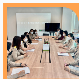
กลุ่มงานพัฒนากฎหมาย