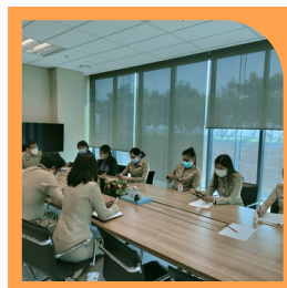
กลุ่มงานกฎหมาย ๑