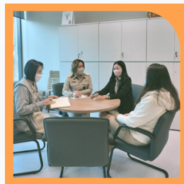
กลุ่มงานบริหารทั่วไป