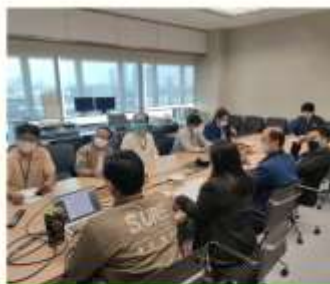
คณะทำงานฯ

เมื่อวันพุธที่ 10 มกราคม พ.ศ. 2567 เวลา 10.00 นาฬิกา ได้มีการประชุมคณะทำงานด้านการคัดเลือกข้าราชการผู้มีคุณธรรมและจริยธรรมดีเด่นของสำนักเทคโนโลยีสารสนเทศและการสื่อสาร ประจำปีงบประมาณ พ.ศ. 2567 ครั้งที่ 1/2567 ณ ห้องประชุมสำนักเทคโนโลยีสารสนเทศและการสื่อสาร ชั้น 4