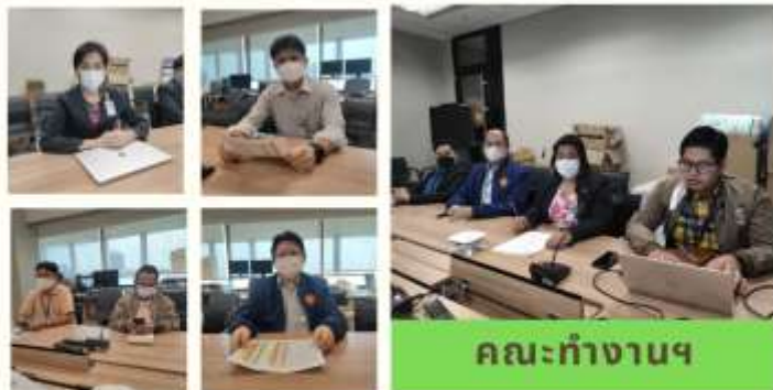
คณะทำงานฯ