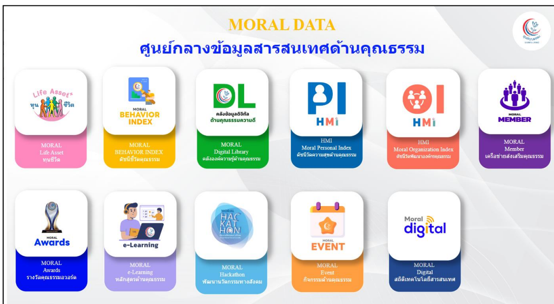
ภาพที่ ๒ ระบบศูนย์กลางข้อมูลสารสนเทศด้านคุณธรรม

๓) คุณธรรมเป็นเรื่องที่เข้าถึงและสัมผัสได้โดยศูนย์คุณธรรมได้พัฒนาระบบสารสนเทศเว็บไซต์และโมบายแอปพลิเคชันเพื่อการให้บริการ การพัฒนาและออกแบบโมบายแอปพลิเคชัน “Moral Touch” และ “Moral Data” เพื่อให้ประชาชนและองค์กรทุกภาคส่วนสามารถเข้าถึงข้อมูลข่าวสาร องค์กรความรู้และนวัตกรรมส่งเสริมคุณธรรมเพื่อให้ตอบโจทย์ภาครัฐ ๔.๐ รวมทั้งการมีกระบวนการค้นหาภัยก่อกวนบุคคล องค์กร/ชุมชน และสื่อที่มีพฤติกรรมสะท้อนการมีคุณธรรม และเป็นแบบอย่างรวมทั้งสร้างแรงบันดาลใจให้กับสังคมเป็นที่ประจักษ์ผ่านรางวัลคุณธรรมอวอร์ด “Moral Awards”