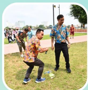
เกมวิบาก