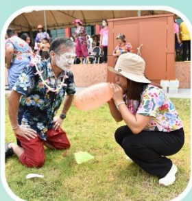
เกมวิบาก (ต่อ)