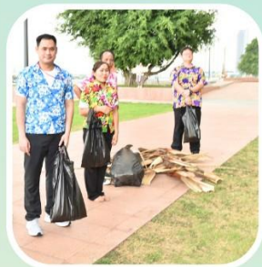
กีฬารักโลก