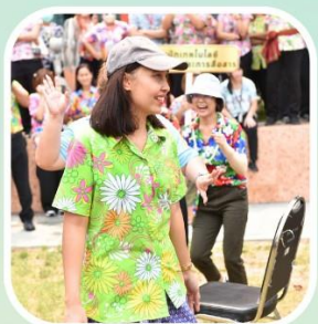
กีฬาเก้าอี้ร้าว