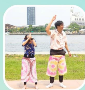
ใส่กางเกงไม่ใช้มือ