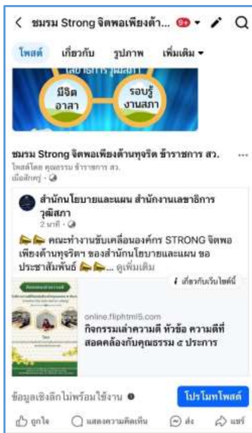
(๔) ประชาสัมพันธ์ช่องทางศูนย์เรียนรู้คุณธรรมและความโปร่งใส - Website Moral.Senate.go.th