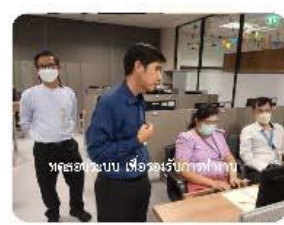
ทดลองระบบ เพื่อรองรับการทำงาน