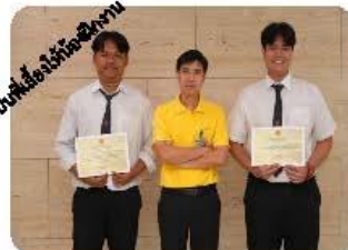
เป็นกำลังใจให้พนักงาน