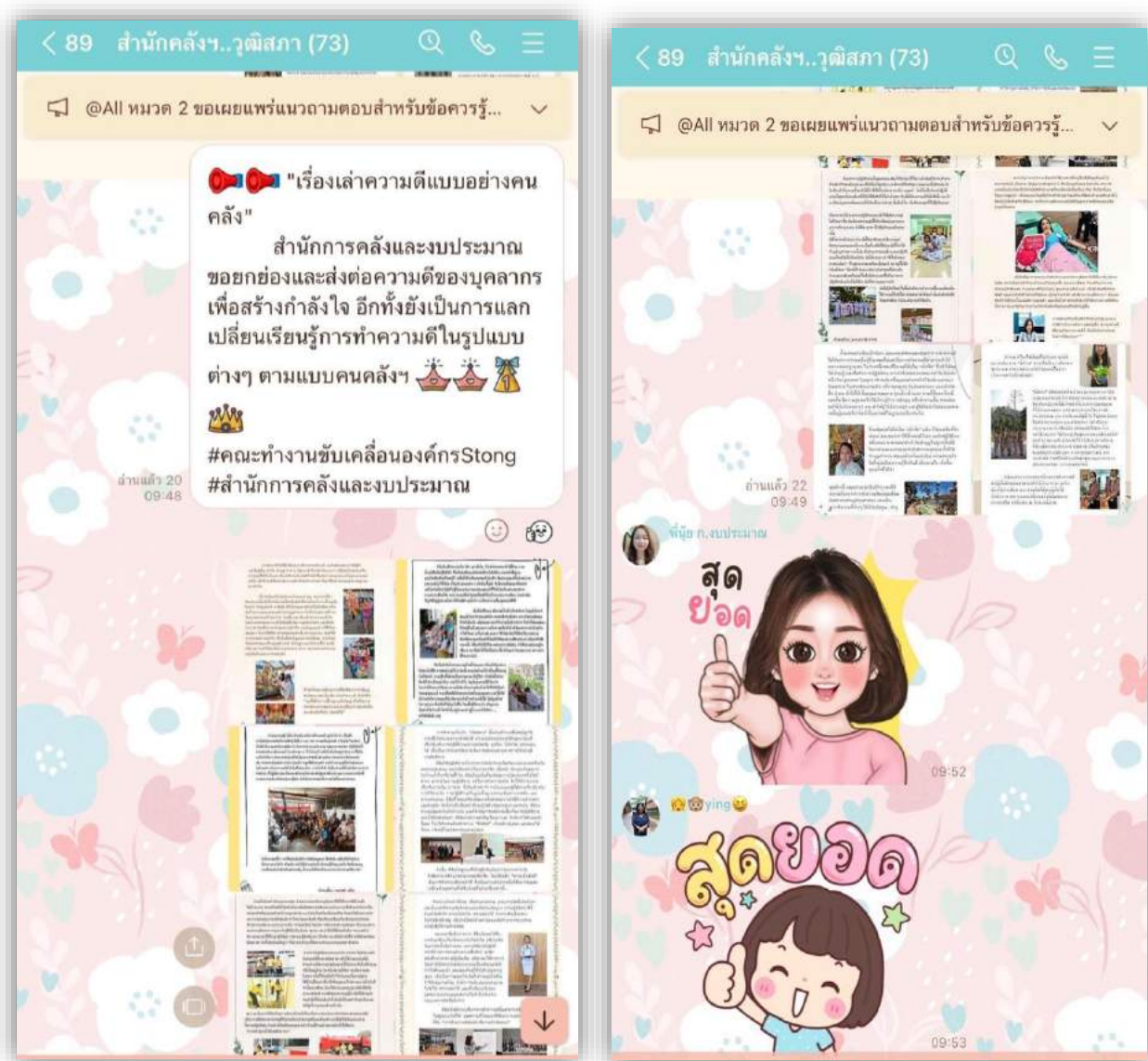
Line Group : สำนักงานการคลังและงบประมาณ

ขั้นตอนที่ ๓ คณะทำงานขับเคลื่อนองค์กร STRONG จิตพอเพียงด้านทุจริตส่งเสริมคุณธรรมและความโปร่งใสของสำนักงานการคลังและงบประมาณ ได้ประชาสัมพันธ์ผลการดำเนินการทางการส่งเสริมความดีภายในสำนักงานการคลังและงบประมาณ ให้บุคคลภายใน และภายนอกองค์กรได้รับทราบ และตลอดจนเกิดการสร้างแบบอย่างที่ดี มีการเปลี่ยนแปลงพฤติกรรมให้ปรากฏชัดเจน และการยกย่องการทำความดี เพื่อการรักษาคนดี โดยได้มีการประชาสัมพันธ์ในช่องทาง แอปพลิเคชัน Line Group สำนักงานการคลังและงบประมาณ และ Fage Facebook : สำนักงานการคลังและงบประมาณ วุฒิสภา , ชมรม Strong จิตพอเพียงด้านทุจริต ข้าราชการ สว. , คุณธรรม ข้าราชการ สว.