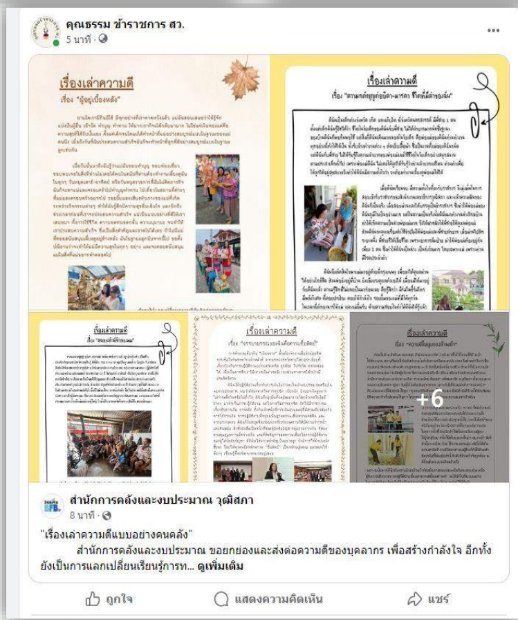
Fage Facebook : สำนักงานคลังและงบประมาณ วุฒิสภา , ชมรม Strong จิตพอเพียงต้านทุจริต ข้าราชการ สว. ,คุณธรรม ข้าราชการ สว.