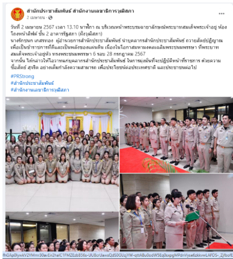
ช่องทางเฟซบุ๊กสำนักประชาสัมพันธ์