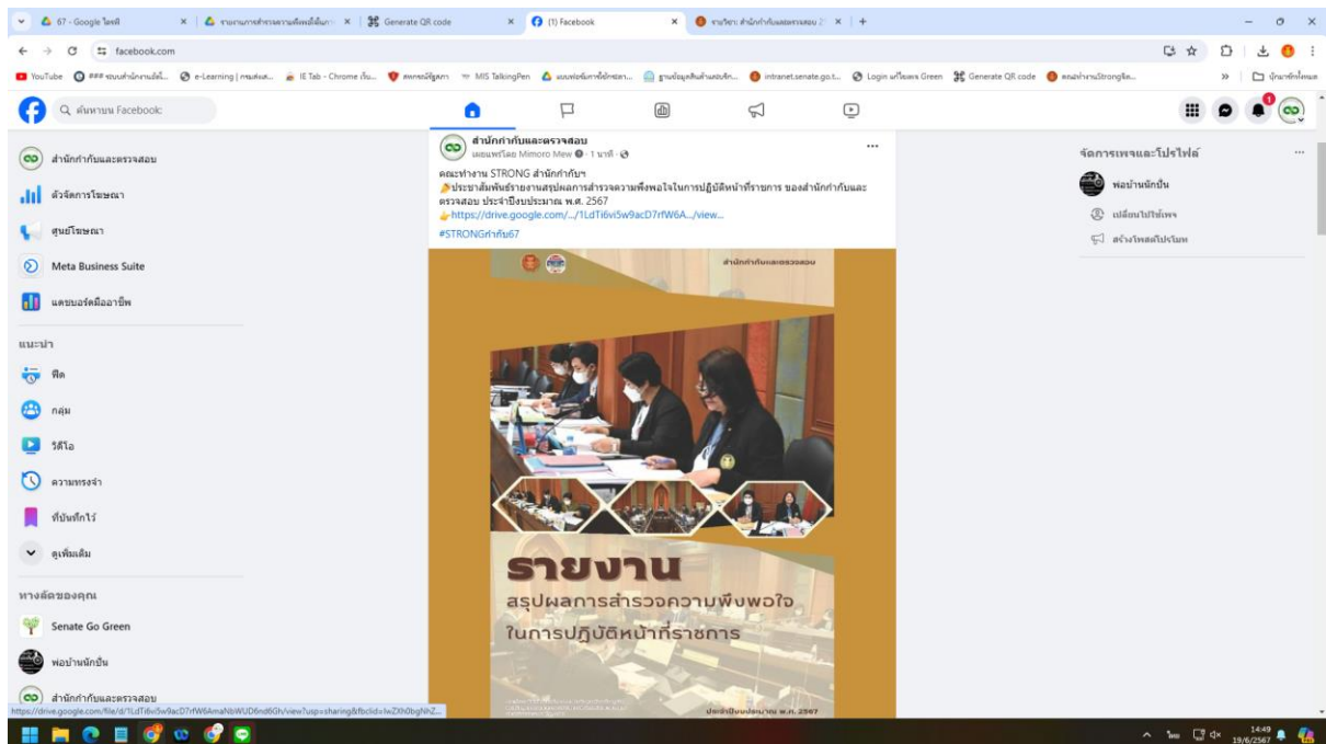
ประชาสัมพันธ์ผ่านช่องทาง Facebook สำนัก