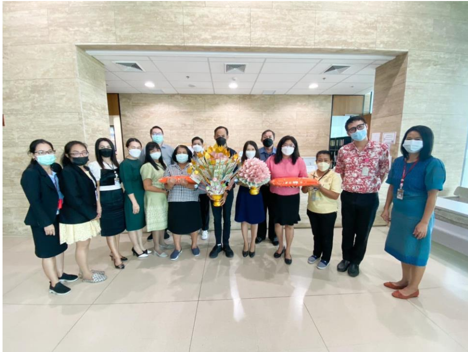
๒. บุคลากรสำนักการคลังและงบประมาณ เข้าร่วมกิจกรรม “สวมผ้าไทย ใส่บาตร ปล่อยปلاميสุข” เนื่องในวันพ่อแห่งชาติ ในวันพฤหัสบดีที่ ๑ ธันวาคม ๒๕๖๕ ณ บริเวณริมแม่น้ำเจ้าพระยา อาคารรัฐสภา (ฝั่งวุฒิสภา)