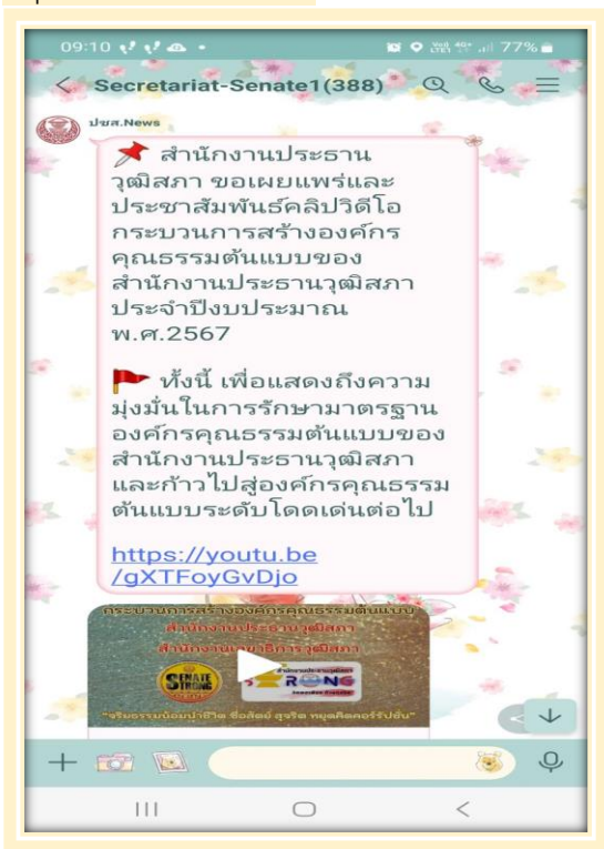
กลุ่ม Line สำนักงานฯ