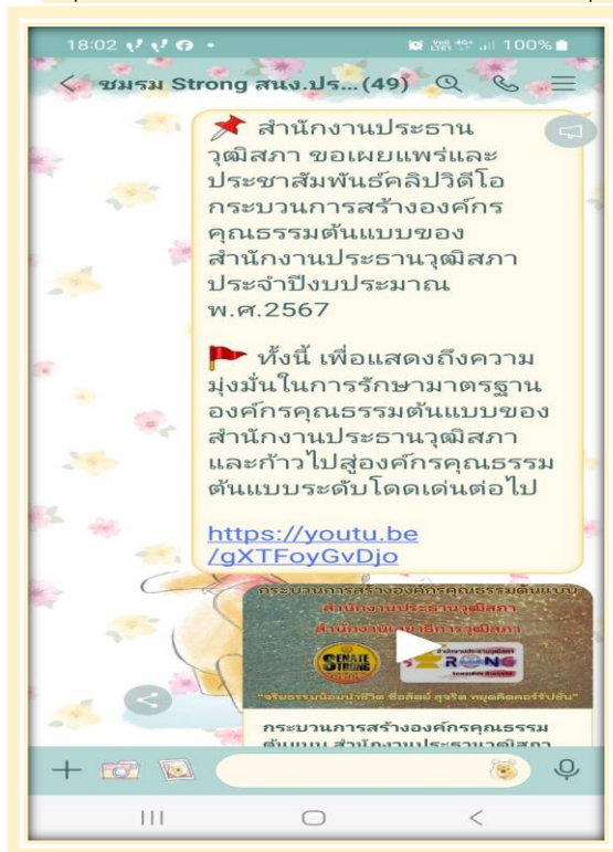
กลุ่ม Line ชมรม Strong สำนักงานประธานวุฒิสภา