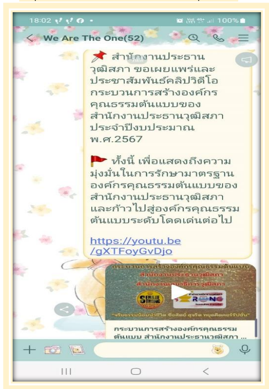
กลุ่ม Line สำนักงานประธานวุฒิสภา