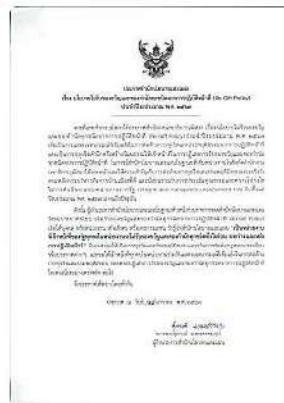
เปิดไฟล์เดสก์ | ๒๕๖ | Keep