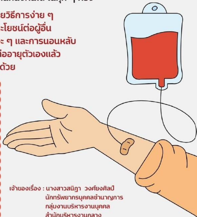
เจ้าของเรื่อง : นางสาวสนิภา วงศ์ยงศิลป์ นักทรัพยากรบุคคลชำนาญการ กลุ่มงานบริหารงานบุคคล สำนักบริหารงานกลาง