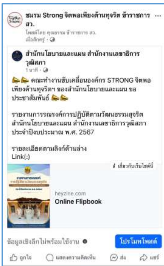
(๔) ประชาสัมพันธ์ช่องทางศูนย์เรียนรู้คุณธรรมและความโปร่งใส - Website Moral.Senate.go.th