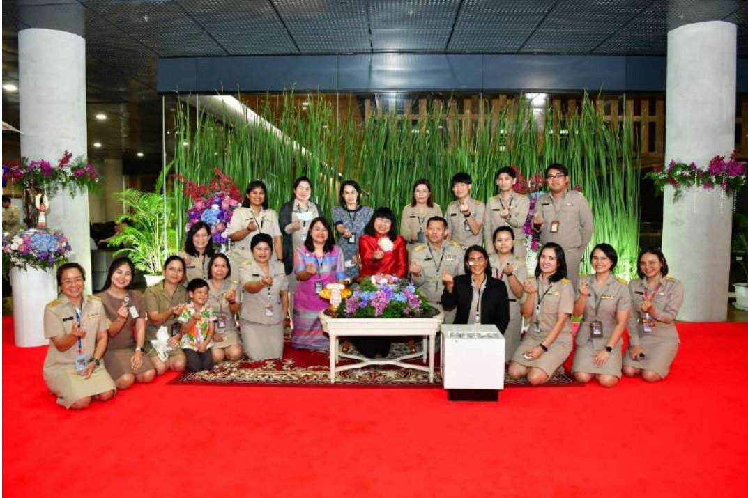
ภาพที่ ๒๑ : การรดน้ำดำหัวผู้ใหญ่สืบสานประเพณีสงกรานต์

๕) กตัญญู โดยการเน้นความกตัญญูช่วยส่งเสริมวัฒนธรรมการเคารพและรู้คุณค่าต่อผู้มีพระคุณ และผู้ร่วมงาน การสร้างความสัมพันธ์ที่ดีภายในองค์กรมีผลทำให้บรรยากาศการทำงานดีขึ้น และบุคลากรมีความสุขในการทำงาน โดยสรุปภาพรวมของการดำเนินการตามคุณธรรมเป้าหมาย กตัญญู ได้ดังนี้