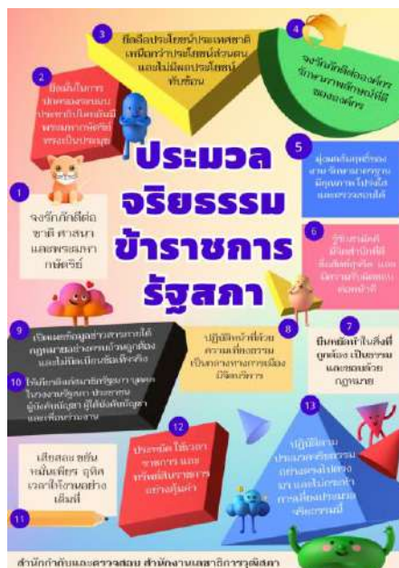
ภาพที่ ๑๔ : การจัดทำสื่อรณรงค์ให้บุคลากรปฏิบัติตามประมวลจริยธรรมข้าราชการรัฐสภา

๒) วินัย โดยการปลูกฝังวินัยในสำนักทำให้บุคลากรมีความรับผิดชอบและปฏิบัติตามระเบียบข้อบังคับ ส่งผลให้งานดำเนินไปอย่างราบรื่นและมีความเป็นระเบียบ การมีวินัยยังช่วยลดความผิดพลาดและเพิ่มความน่าเชื่อถือในการดำเนินงาน โดยสรุปภาพรวมของการดำเนินกิจกรรมตามคุณธรรมเป้าหมาย วินัย ได้ดังนี้