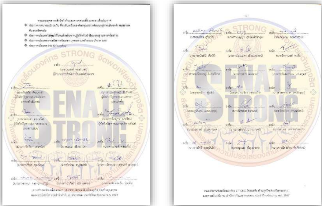
ภาพที่ ๓ : การประชาสัมพันธ์เพื่อขับเคลื่อนนโยบายไม่รับของขวัญและของกำนัลทุกชนิด (No Gift Policy) จากการปฏิบัติหน้าที่