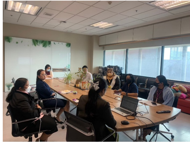
ภาพการประชุมคณะทำงาน