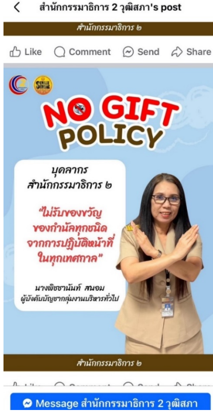
ภาพตัวอย่างการรณรงค์ให้ปฏิบัติตามนโยบาย No Gift Policy ทั้งในระดับสำนักและกลุ่มงาน