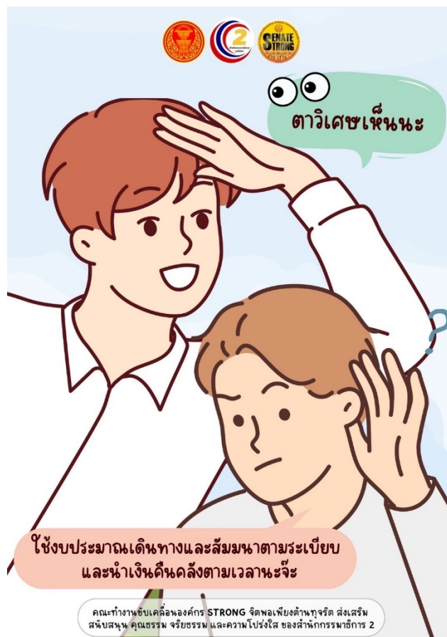
ภาพ Infographic ที่ใช้ในการเฝ้าระวังการทุจริต