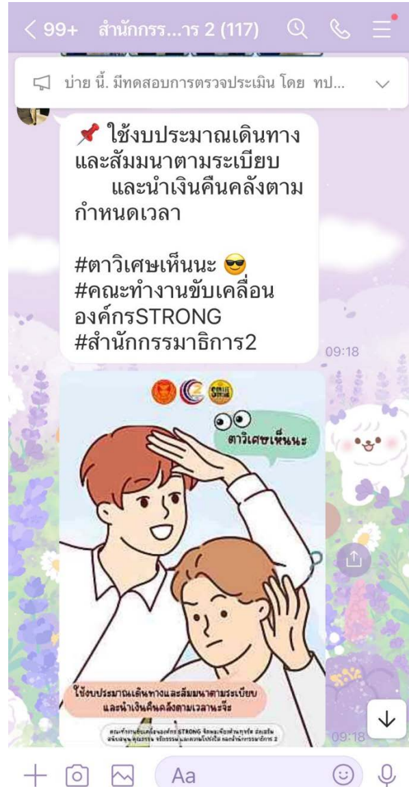
ภาพการเผยแพร่ประชาสัมพันธ์