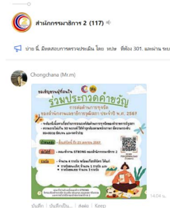
ภาพการประชาสัมพันธ์เชิญชวนประกวดคำขวัญ