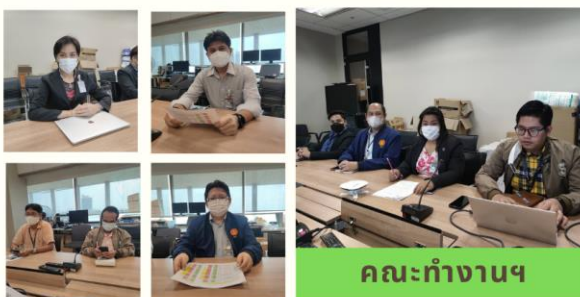
คณะทำงานฯ