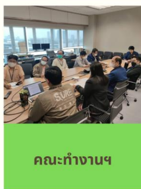
คณะทำงานฯ

เมื่อวันที่ 10 มกราคม พ.ศ. 2567 เวลา 10.00 นาฬิกา ได้มีการประชุมคณะทำงานด้านการคัดเลือกข้าราชการผู้มีคุณธรรมและจริยธรรมดีเด่น ของสำนักเทคโนโลยีสารสนเทศและการสื่อสาร ประจำปีงบประมาณ พ.ศ. 2567 ครั้งที่ 1/2567 ณ ห้องประชุมสำนักเทคโนโลยีสารสนเทศและการสื่อสาร ชั้น 4