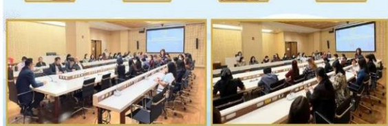
คณะทำงานขับเคลื่อนองค์กร STRONG จัดเพื่อพัฒนาคุณธรรมและความโปร่งใส