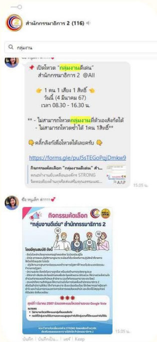
(ภาพกระบวนการคัดเลือกกลุ่มงานที่มีผลงานด้านคุณธรรมและความโปร่งใสดีเด่น)