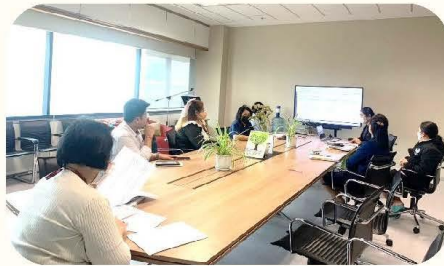
(ภาพการประชุมคณะทำงานขับเคลื่อนองค์กร STRONG)