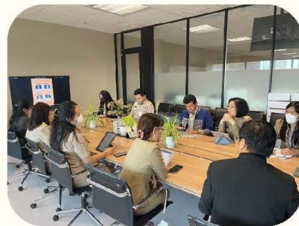
(ภาพการประชุมสำนักกรรมการธิการ ๒)

กลุ่มงานที่มีผลงานด้านคุณธรรมและความโปร่งใสดีเด่นของสำนักกรรมการธิการ ๒