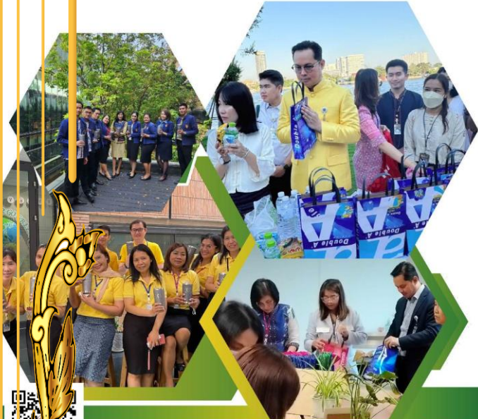
คณะทำงานขับเคลื่อนองค์กร STRONG จัดพอเพียงด้านทุจริต ส่งเสริมคุณธรรมและความโปร่งใสของสำนักกรรมการ 2 ประจำปีงบประมาณ พ.ศ. 2567

การนำหลักปรัชญาเศรษฐกิจพอเพียงมาประยุกต์ใช้ ของสำนักกรรมการ ๒ ประจำปีงบประมาณ พ.ศ. ๒๕๖๗