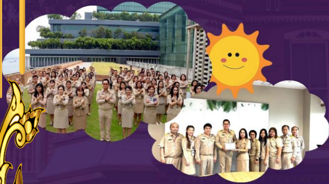
คณะทำงานขับเคลื่อนองค์กร STRONG จัดพอเพียงด้านทุจริต ส่งเสริม สนับสนุน คุณธรรม จริยธรรม และความโปร่งใสของสำนักกรรมการธิการ 2