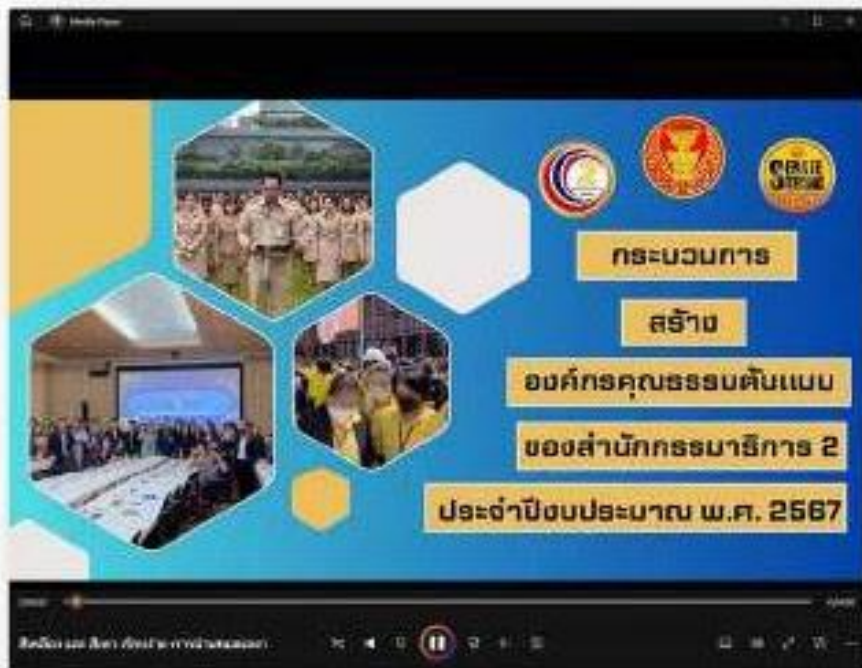
ภาพคลิ่ววีดีโอ เรื่อง กระบวนการสร้างองค์กรคุณธรรมต้นแบบ และคลิ่ววีดีโอ เรื่อง ประกาศเจตนารมณ์ร่วมกันที่จะขับเคลื่อนองค์กรคุณธรรมต้นแบบ สำนักกรมการ ๒