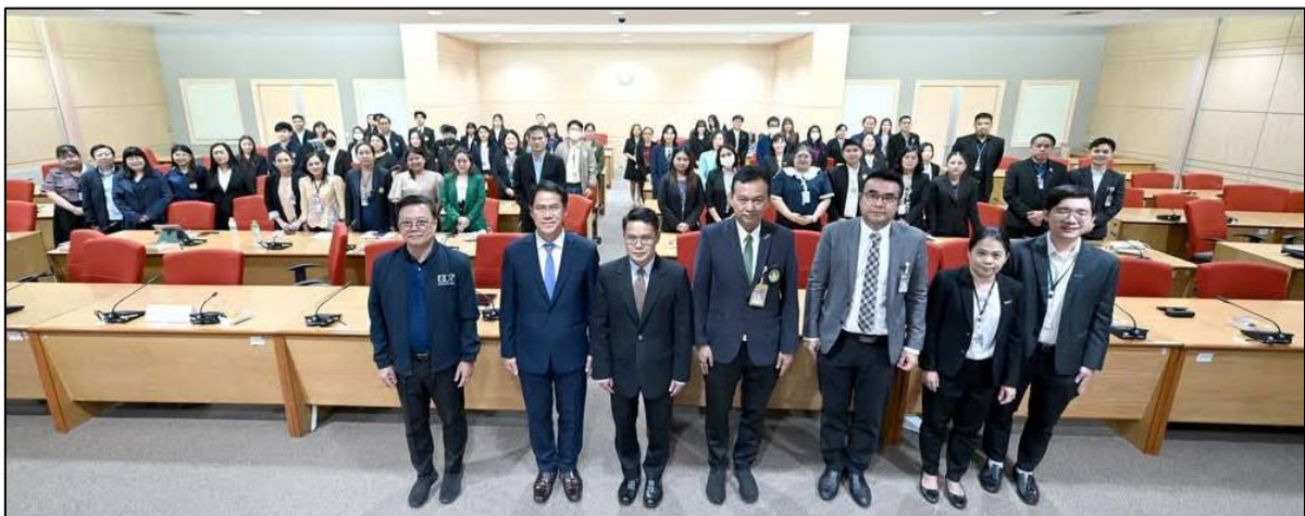
กิจกรรมแลกเปลี่ยนเรียนรู้การขับเคลื่อนองค์กรคุณธรรมต้นแบบกับหน่วยงานภายนอกของสำนักนโยบายและแผน