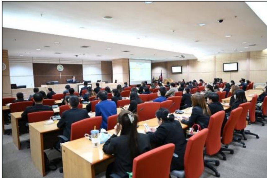
กิจกรรมแลกเปลี่ยนเรียนรู้การขับเคลื่อนองค์กรคุณธรรมต้นแบบกับหน่วยงานภายนอกของสำนักงานนโยบายและแผน