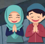
กิจกรรมส่งเสริม การปฏิบัติตามหลักศาสนา