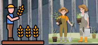
กิจกรรมนำหลักปรัชญา ของเศรษฐกิจพอเพียง