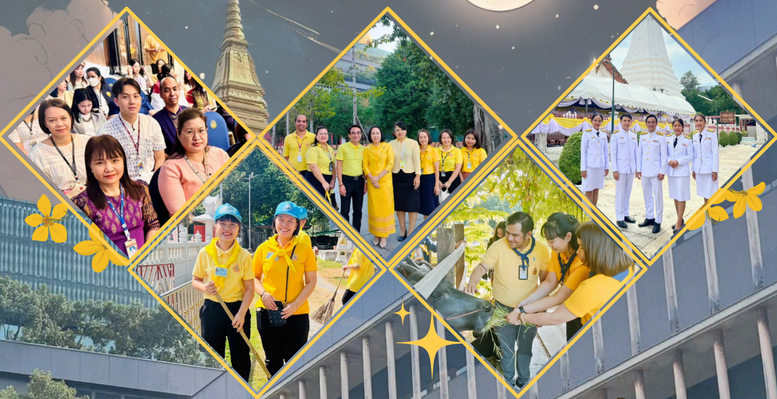
กิจกรรมขับเคลื่อน องค์การคุณธรรมด้วยมิติวัฒนธรรม