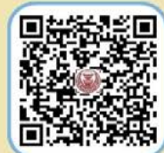
๑. ประกาศ เจตนารมณ์ร่วมกัน