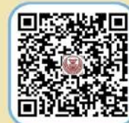
๕. ประกาศ การป้องกันและแก้ไขปัญหา ล่วงละเมิดหรือคุกคามทางเพศ