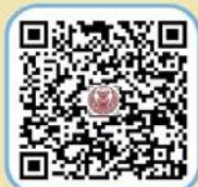
๔. ประกาศ นโยบายใหม่รับของขวัญ

ในการยกระดับการขับเคลื่อนมาตรฐานองค์กรคุณธรรมต้นแบบฯ รวมทั้งประกาศนโยบายอื่น ๆ ที่เกี่ยวข้อง ประจำปีงบประมาณ พ.ศ. ๒๕๖๘