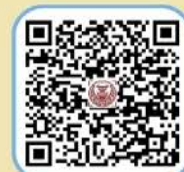
๓. ประกาศ นโยบายการบริหาร ทรัพยากรบุคคล