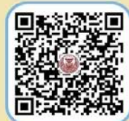
๒. ประกาศ มาตรการให้คูดณีไทย