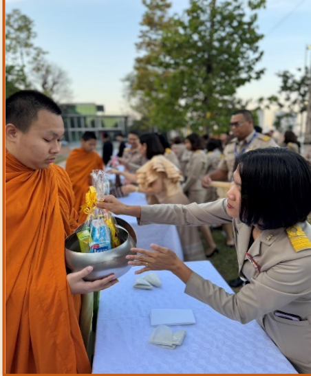
คณะทำงานขับเคลื่อนองค์กร STRONG จิตพอเพียงต้านทุจริต ส่งเสริม คุณธรรม และความโปร่งใส ของสำนักงานประชุม ประจำปีงบประมาณ พ.ศ. ๒๕๖๘