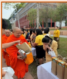
คณะทำงานขับเคลื่อนองค์กร STRONG จิตพอเพียงต้านทุจริต ส่งเสริม คุณธรรม และความโปร่งใส ของสำนักงานประชุม ประจำปีงบประมาณ พ.ศ. ๒๕๖๘