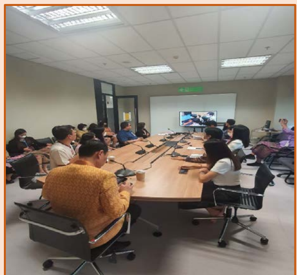
คณะทำงานขับเคลื่อนองค์กร STRONG จิตพอเพียงต้านทุจริต ส่งเสริม คุณธรรม และความโปร่งใส ของสำนักงานประชุม ประจำปีงบประมาณ พ.ศ. ๒๕๖๘