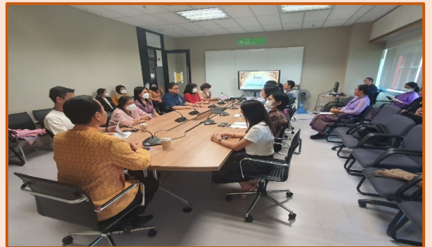
คณะกรรมการขับเคลื่อนองค์กร STRONG จิตพอเพียงต้านทุจริต ส่งเสริม คุณธรรม และความโปร่งใส ของสำนักงานการประชุม ประจำปีงบประมาณ พ.ศ. ๒๕๖๘