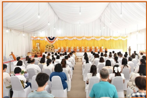
คณะทำงานขับเคลื่อนองค์กร STRONG จิตพอเพียงต้านทุจริต ส่งเสริม คุณธรรม และความโปร่งใส ของสำนักงานประชุม ประจำปีงบประมาณ พ.ศ. ๒๕๖๘