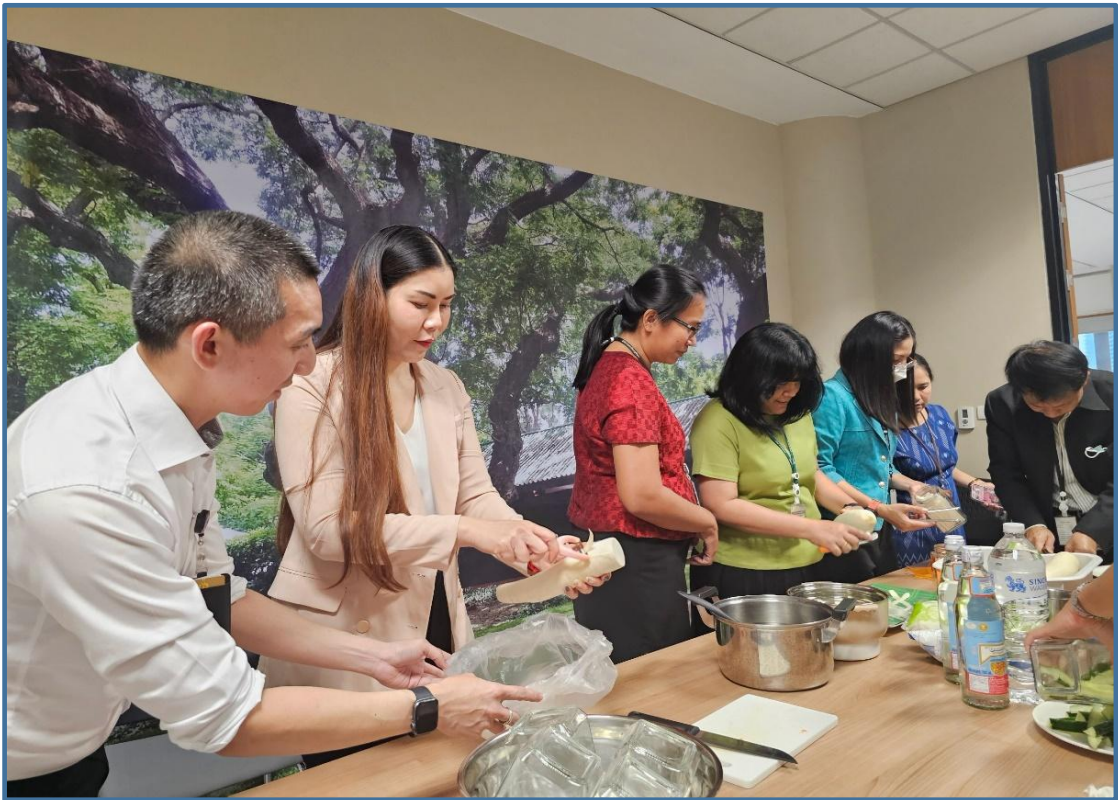
คณะกรรมการขับเคลื่อนองค์กร STRONG จัดพอเพียงต้านทุจริต ส่งเสริมคุณธรรมและความโปร่งใส ของสำนักงานการประชม ประจำปีงบประมาณ พ.ศ. ๒๕๖๘