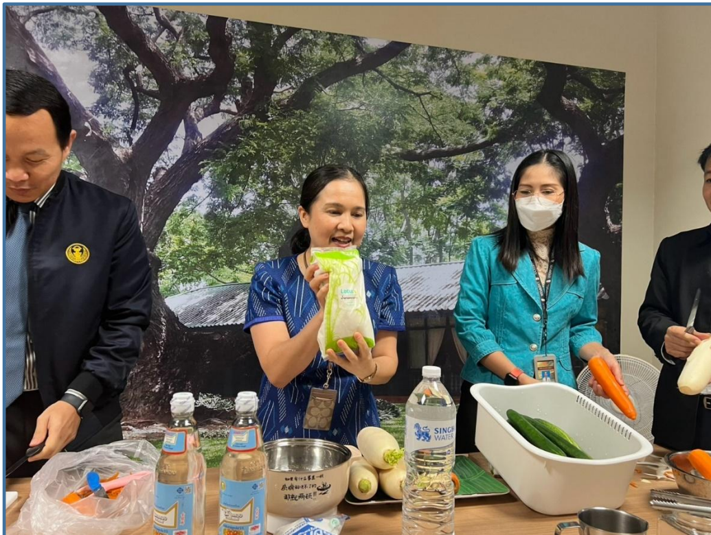
คณะทำงานขับเคลื่อนองค์กร STRONG จิตพอเพียงต้านทุจริต ส่งเสริมคุณธรรมและความโปร่งใส ของสำนักงานการประจวบ ประจำปีงบประมาณ พ.ศ. ๒๕๖๘