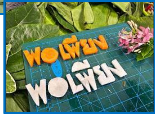
คณะทำงานขับเคลื่อนองค์กร STRONG จิตพอเพียงต้านทุจริต ส่งเสริมคุณธรรมและความโปร่งใส ของสำนักงานประชุม ประจำปีงบประมาณ พ.ศ. ๒๕๖๘