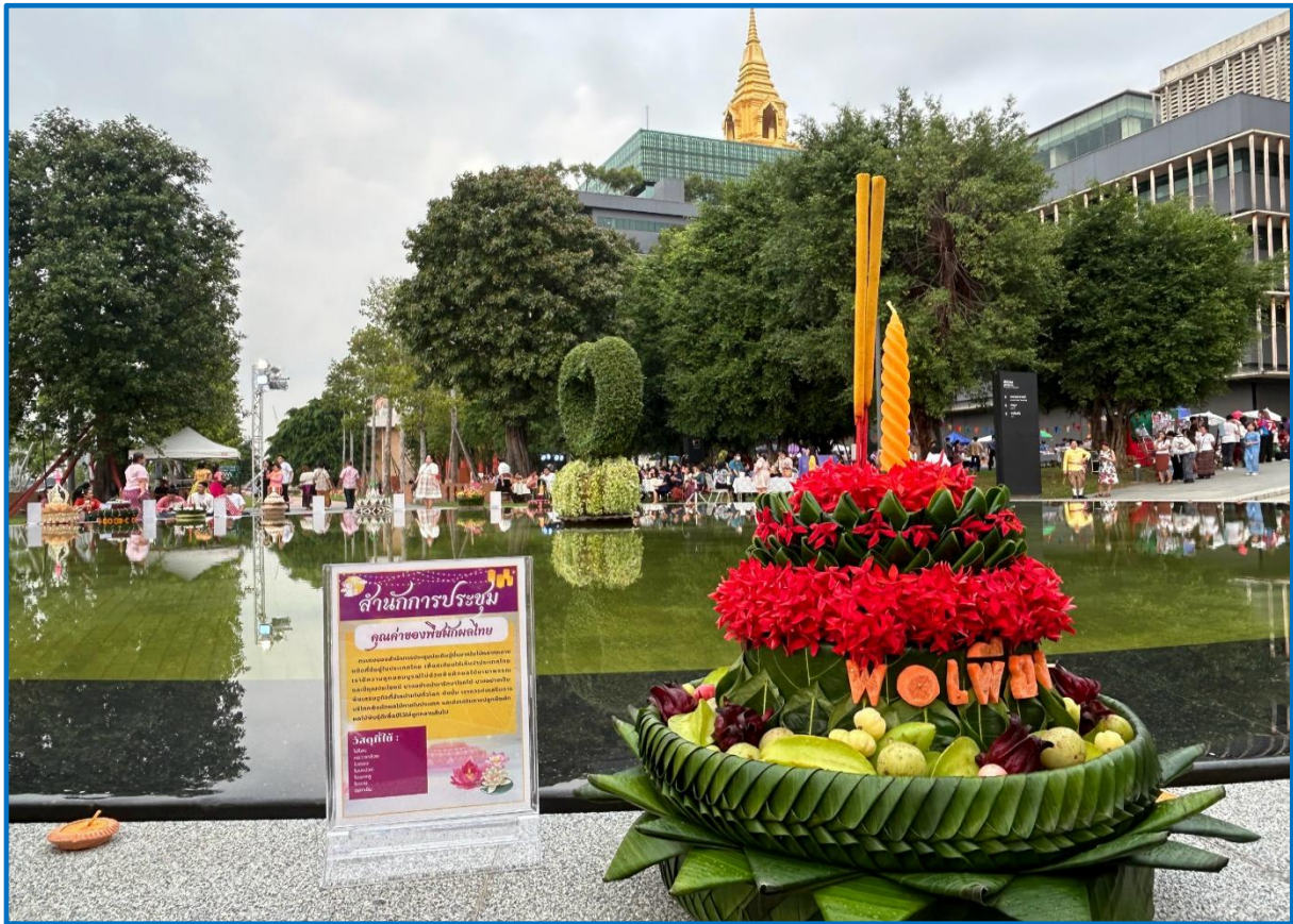
คณะทำงานขับเคลื่อนองค์กร STRONG จิตพอเพียงต้านทุจริต ส่งเสริมคุณธรรมและความโปร่งใส ของสำนักการประชุม ประจำปีงบประมาณ พ.ศ. ๒๕๖๘