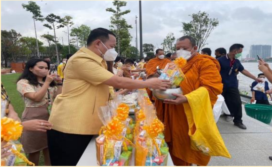
กิจกรรม “สวมผ้าไทย ใส่บาตร ปล่อยปลา มีสุข”