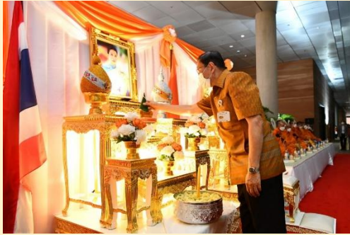
กิจกรรม “ร้อยรวมใจแสดงความจงรักภักดี” สวดมนต์บทสวด “โพชฌังคปริตร” ถวายพระพรสมเด็จพระเจ้าลูกเธอเจ้าฟ้าพัชรกิติยาภา นเรนทิราเทพยวดี กรมหลวงราชสาริณีสิริพัชร มหาวัชรราชธิดา (บริเวณสระมรกต)