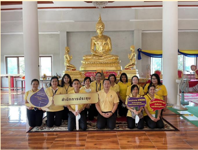
กิจกรรมเครือข่ายเพื่อสร้างความ ร่วมมือในการขับเคลื่อนสังคมคุณธรรม ณ วัดแคใน และโรงเรียนวัดแคใน