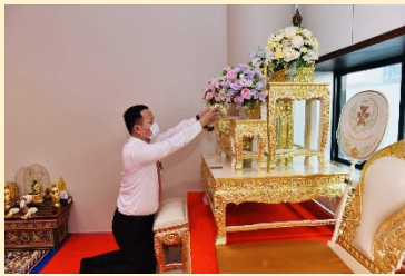
ร่วมพิธี "ร้อยรวมใจแสดงความจงรักภักดี" สวดมนต์บทสวด "โพชฌังคปริตร" และนั่งสมาธิ เพื่อถวายพระพรสมเด็จพระเจ้าลูกเธอเจ้าฟ้าพัชรกิติยาภา นเรนทิราเทพยวดี กรมหลวงราชสาริณีสิริพัชร มหาวัชรราชธิดา (ห้องพระพุทธรูปมงคลนิมิตสถิต ณ รัฐสภา)