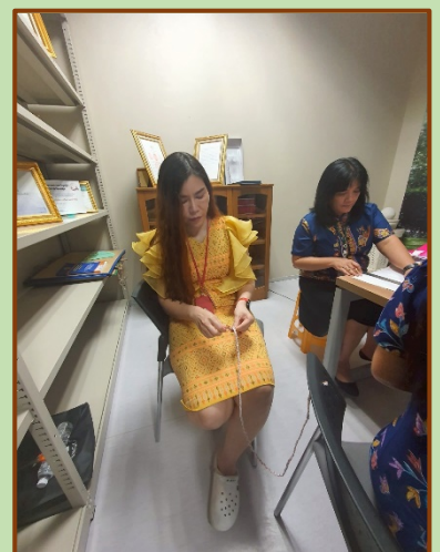
คณะทำงานขับเคลื่อนองค์กร STRONG จิตพอเพียงต้านทุจริต ส่งเสริม คุณธรรม และความโปร่งใส ของสำนักงานประชุม ประจำปีงบประมาณ พ.ศ. ๒๕๖๘