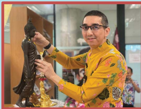
คณะทำงานขับเคลื่อนองค์กร STRONG จิตพอเพียงด้านทุจริต ส่งเสริมคุณธรรมและความโปร่งใส ของสำนักงานประชุม ประจำปีงบประมาณ พ.ศ. ๒๕๖๘