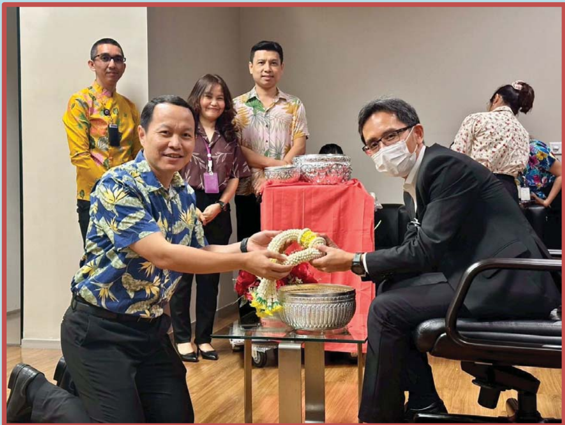
คณะทำงานขับเคลื่อนองค์กร STRONG จิตพอเพียงด้านทุจริต ส่งเสริมคุณธรรมและความโปร่งใส ของสำนักงานประชุม ประจำปีงบประมาณ พ.ศ. ๒๕๖๘