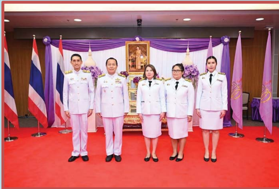
คณะทำงานขับเคลื่อนองค์กร STRONG จิตพอเพียงด้านทุจริต ส่งเสริมคุณธรรมและความโปร่งใส ของสำนักงานประชุม ประจำปีงบประมาณ พ.ศ. ๒๕๖๘