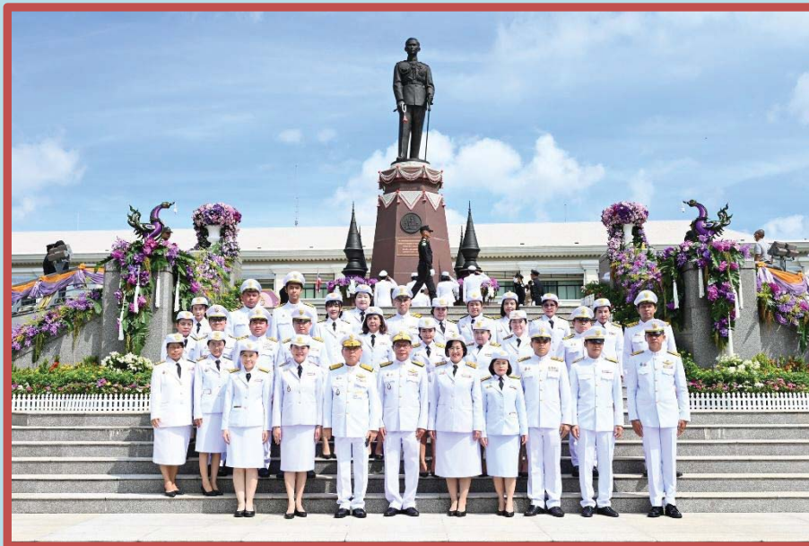
คณะทำงานขับเคลื่อนองค์กร STRONG จิตพอเพียงด้านทุจริต ส่งเสริมคุณธรรมและความโปร่งใส ของสำนักงานประชุม ประจำปีงบประมาณ พ.ศ. ๒๕๖๘