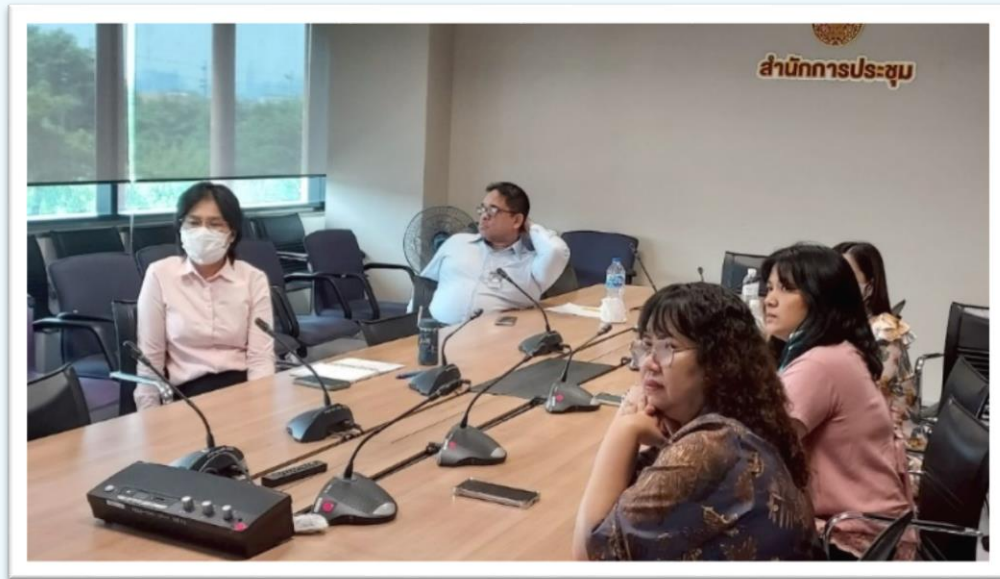
คณะทำงานฯ คณะที่ ๒