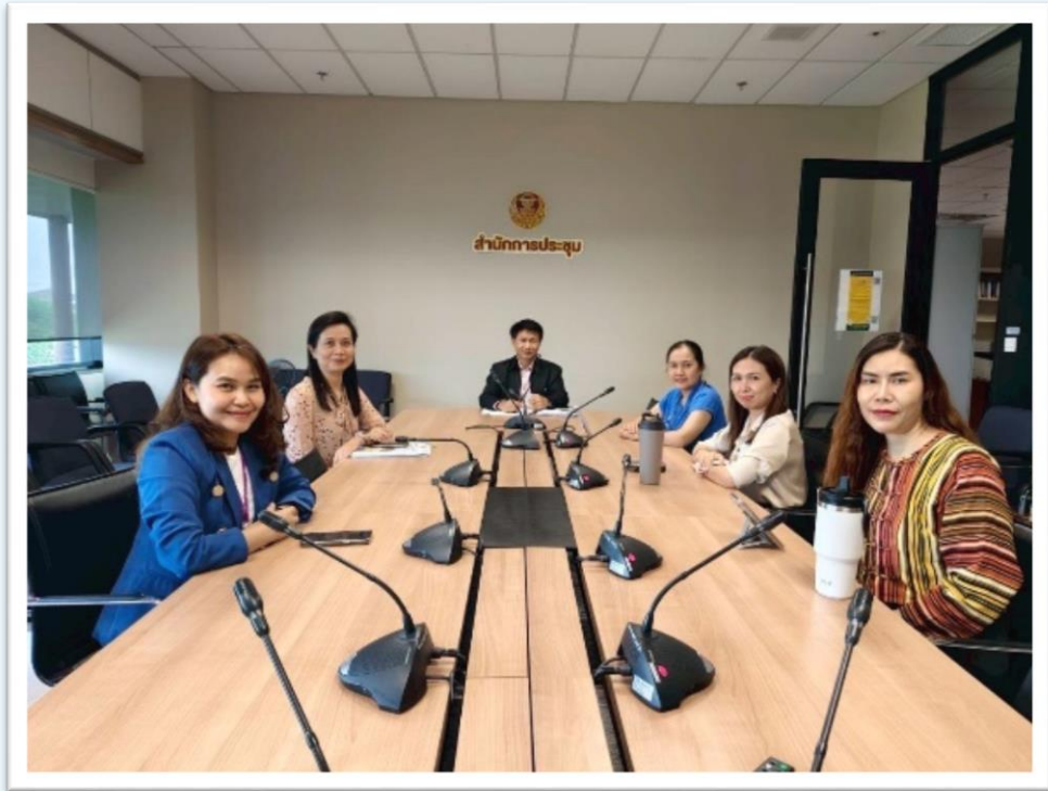
คณะทำงานฯ คณะที่ ๔