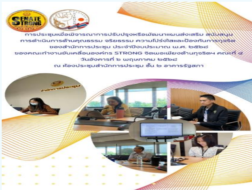
คณะทำงานฯ คณะที่ ๓