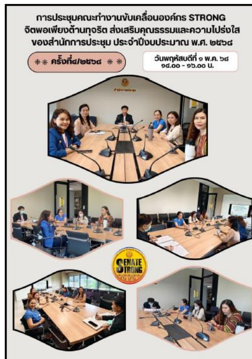
๔. รูปภาพการจัดกิจกรรม