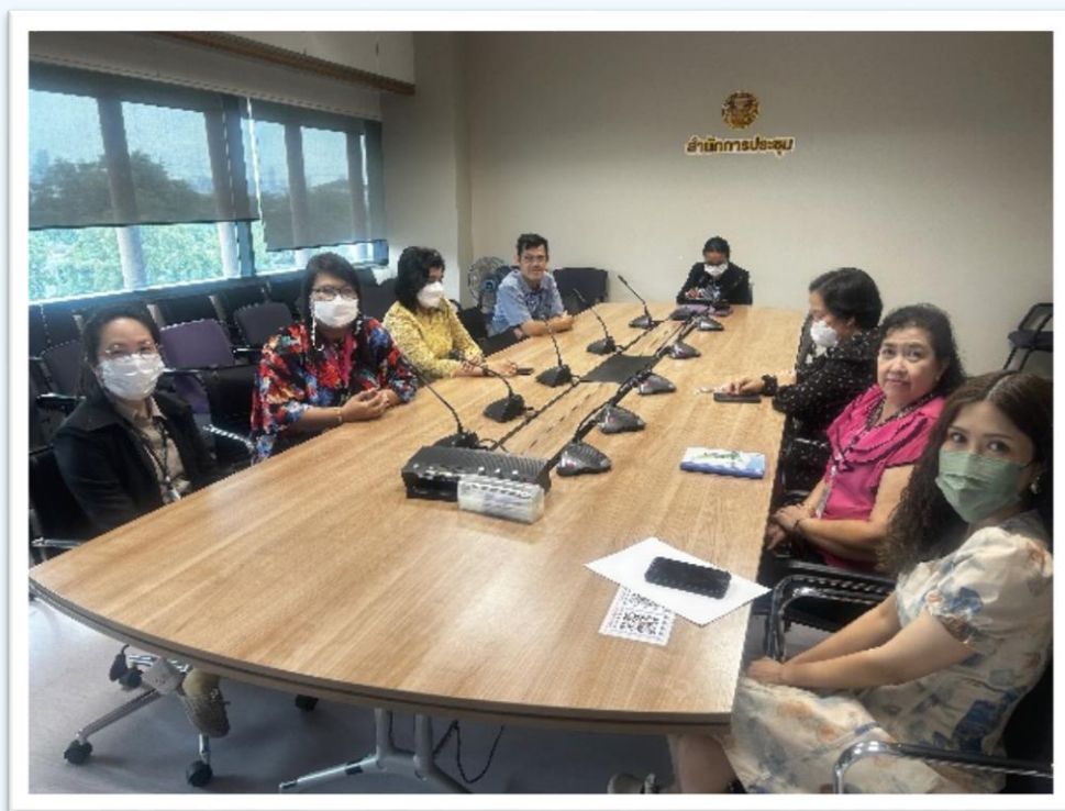
คณะทำงานฯ คณะที่ ๑

๑. ภาพแสดงการดำเนินการพิจารณาปรับปรุงหรือพัฒนาแผนส่งเสริมคุณธรรม ของคณะทำงานขับเคลื่อนองค์กร STRONG จิตพอเพียงด้านทุจริต ส่งเสริมคุณธรรมและความโปร่งใส ของสำนักงานการประชุม ประจำปีงบประมาณ พ.ศ. ๒๕๖๘