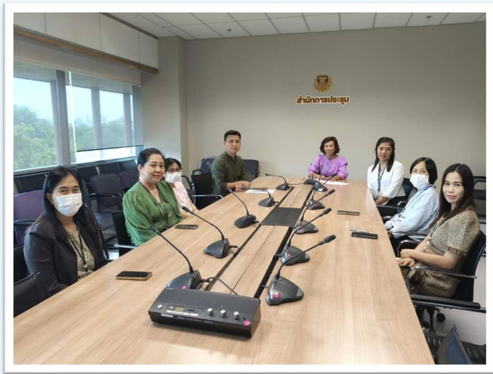
คณะทำงานฯ คณะที่ ๕